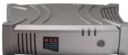
Installable en rack: 2U seulement.

Protection de 1 à 4 stations de travail ou serveurs économiques