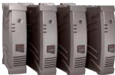
Une gamme complète.